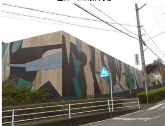
ヒューマンヒルズ函南調整池の壁面