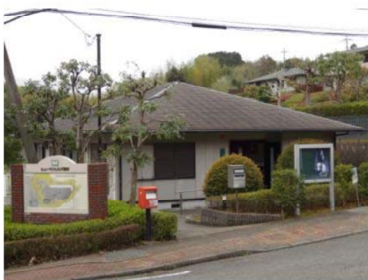
ヒューマンヒルズ函南入口部にある集会所