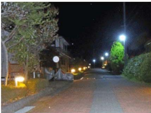
緑地灯と防犯灯が彩る夜の街路