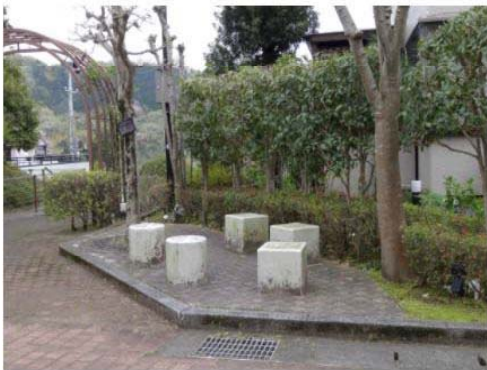
ちょっとお喋り、路傍のポケットパーク