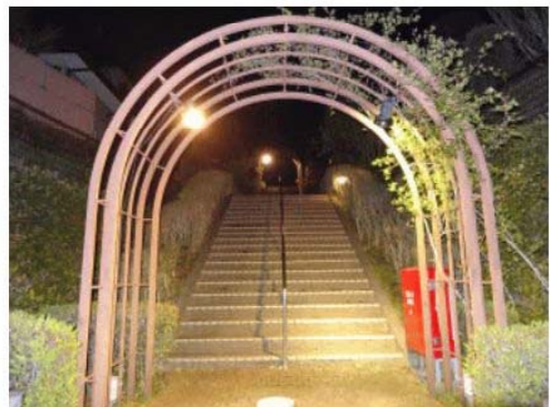
バラのアーチとスポット灯