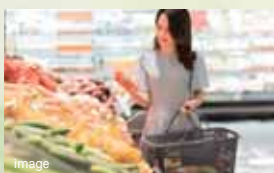
フードストアあおき函南店 (約5,320m・車約8分)