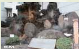
熱海温泉地 (約18.2km・車約28分)