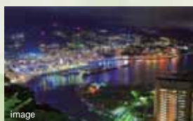
伊東温泉地 (約35.3km・車約53分)