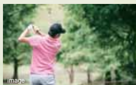
かんなみスプリングカントリークラブ (約3,430m・車約6分)

せつかくの良い環境も、手入れを怠ってはいけません。そこで「ヒューマンヒルズ函南」の自治会では環境維持・整備のための担当役員を置き、快適な環境の維持に努めています。その適用範囲は公園や集会所といった公共施設だけでなく、協定緑地帯といったセミパブリックスペースにまで及び、自治会とその委託する整備業者の手で、快適で美しい街が維持されていきます。